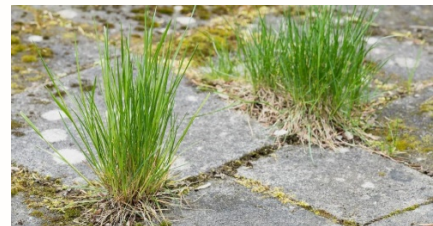
Onkruid op de stoep

Welke natuur zie jij dicht bij jouw huis?