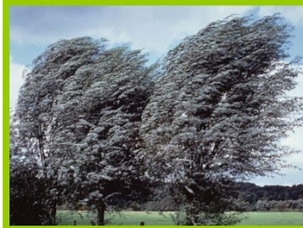
Beroemde mensen krijgen meer kritiek