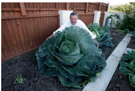
Hij groeit als kool : hij groeit snel